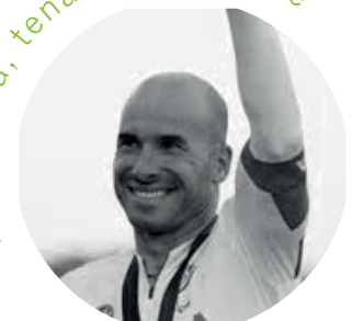
Vittorio Podestà Atleta e campione paralimpico di handbike

Gestione dell'incertezza e della volatilità, anttfragile