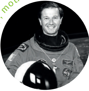
Maurizio Cheli Astronauta, progettista e Imprenditore

Creatività, pensiero laterale, innovazione